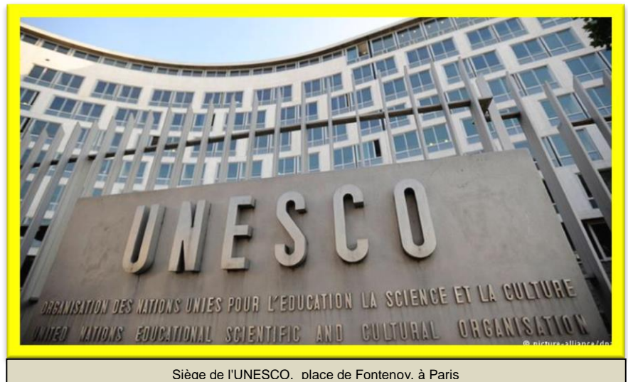
Siège de l'UNESCO. place de Fontenov. à Paris

Ce vendredi 31 mars, un accusé de réception, émanant du secrétariat du comité du patrimoine mondial de l'organisation des Nations unies pour l'éducation, la science et la culture, est parvenu au siège hallois de la fédération colombophile belge. Loin de déplaire au président national sensible aux honneurs, ce courrier concrétise la première partie d'un déjà très volumineux cursus administratif mené avec succès (ce sera l'objet d'un prochain article).