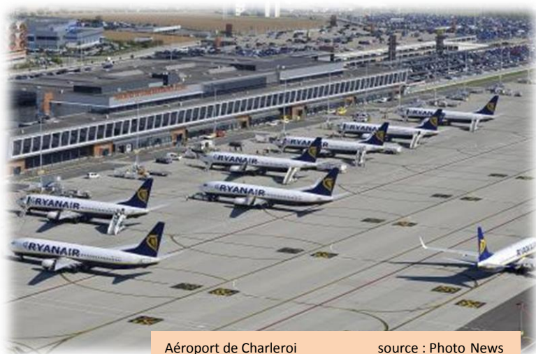
Aéroport de Charleroi

Qu'en est-il par contre d'une éventuelle demande de protection des installations aéroportuaires belges en pleine expansion qui relèvent aussi de la compétence du Ministre du Bien-être animal. Cette piste mériterait, en fonction de ce qui a été évoqué pour les installations françaises, d'être creusée pour garantir au maximum la sécurité des passagers transportés, les aéroports de Charleroi/Gosselies ( inspection-ebci@spw.wallonie.be ), 6,7 millions de passagers en 2013, et de Liège Bierset-Aéroport Liège/Bierset ( inspection-ebgl@spw.wallonie.be ) étant considérés des